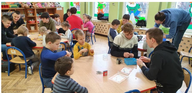
fot. Zajęcia w Przedszkolu nr 30 w Rudzie Śląskiej

Więcej w 'Relacjach z wydarzeń na stronie www.sep.katowice.pl .