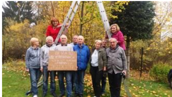
Fot. Wspomnienie z Kamesznicy

Tradycyjnie, jak co roku, odbył się Rajd Kół Terenowych OZW SEP.