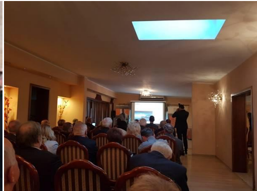
Wykład z okazji Dnia Inżyniera Budownictwa w Hotelu Trojak