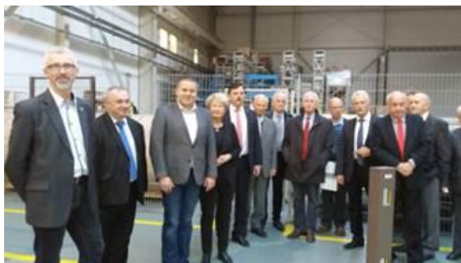
Fot. W hali produkcyjnej szynoprzewodów