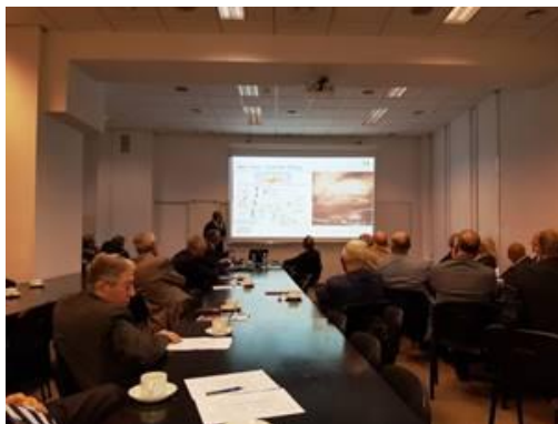
Fot. Posiedzenie Komitetu Elektrotechniki PAN