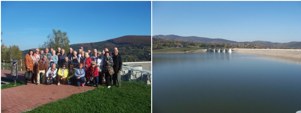
Fot. Nad zaporą

40 osób z Klubu Seniora i Koła Terenowego z osobami towarzyszącymi uczestniczyło w wycieczce techniczno- turystycznej do Suchoj Beskidzkiej oraz zapory i elektrowni w Świnnej Porębie. Więcej na stronie internetowej OZW SEP w dziale Aktualności.