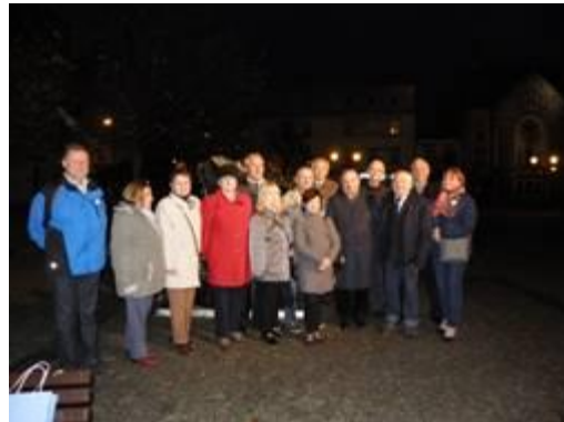
Fot. 40 m pod ziemią w Zabytkowej Kopalni Srebra Fot. Pożegnanie na Tarnogórskim Rynku