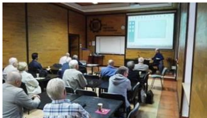
Fot. Zebranie Koła Terenowego

30 osób uczestniczyło w zebraniu Koła Terenowego nr 26; wysłuchano referatu i przeprowadzono 3 konkursy z nagrodami z tematyki z poprzedniego zebrania Koła.