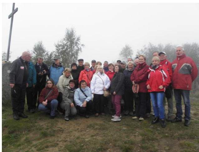
Fot.2. Uczestnicy Rajdu na „Koczym Zamku”

Koniaków, 4- 5 października – Regionalny Rajd Kół Terenowych SEP . Podobnie jak 5 lat temu z okazji Jubileuszu 90-lecia OZW SEP , a teraz z okazji 95-lecia odbył się rajd do Koniakowa. Wzięło w nim udział 30 osób, w tym 12 członków Komisji Kwalifikacyjnych OZW.