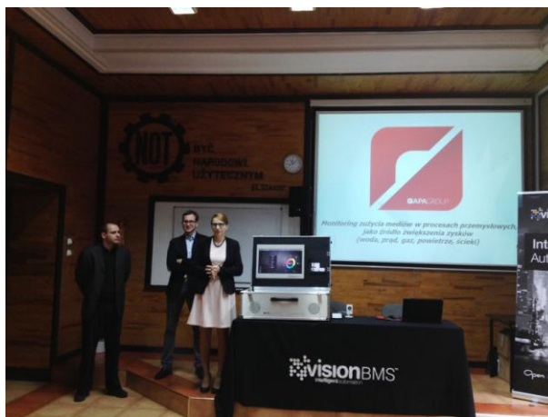
Fot.9. Wykładowcy z firmy APA Sp. z o.o.

Katowice, 28 października – seminarium szkoleniowe dla członków SEP oraz ŚOIIB pt. „Monitoring zużycia mediów w procesach przemysłowych jako źródło zwiększenia zysków (dla wody, prądu, gazu, powietrza i ścieków)” – wykładowcy z firmy APA Sp. z o.o. z Gliwic.