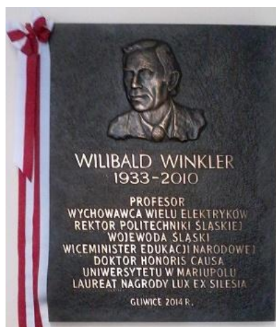
Fot. 10. Tablica w holu budynku A Wydziału Elektrycznego Politechniki Śląskiej