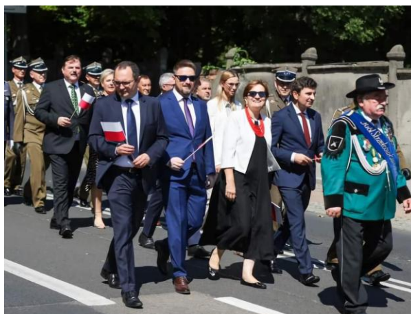
fot. Przemarsz z Placu Sejmu Śląskiego pod pomnik na Osiedlu Paderewskiego

Udział członków OZW w obchodach Święta Wojska Polskiego organizowanych przez miasto Katowice.