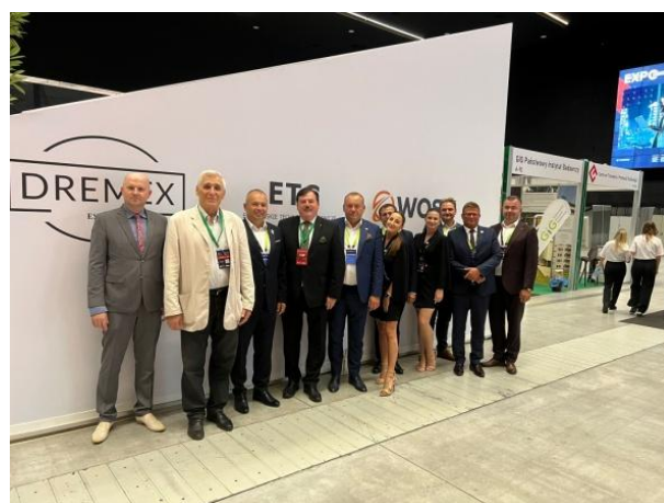
fot. Jeden z paneli dyskusyjnych, zdjęcie pamiątkowe