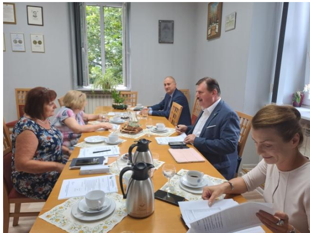
fot. Prezydium obraduje w sali prezydialnej OZW.

Na posiedzeniu Prezydium OZW SEP podsumowano finansowo XI Katowickie Dni Elektryki i imprezy towarzyszące zorganizowane z okazji 105-lecia OZW SEP. Omówiono sprawy bieżące, w tym przygotowanie do zebrania zarządu w dniu 10 września br. w Elektrowni Jaworzno III, gdzie działa Koło SEP nr 38. Ustalono terminarz spotkań prezydium i imprez w II półroczu 2024 r.