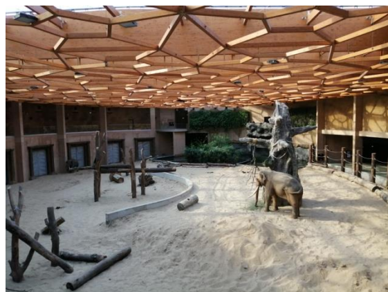
Wybieg dla słońi