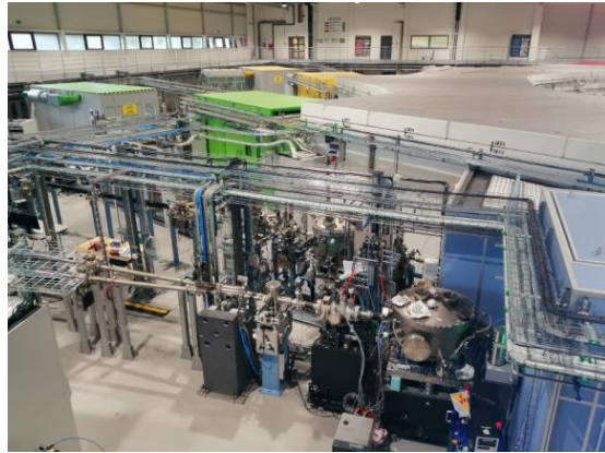
Zwiedzanie Ośrodka Badawczego Uniwersytetu Jagiellońskiego SOLARIS