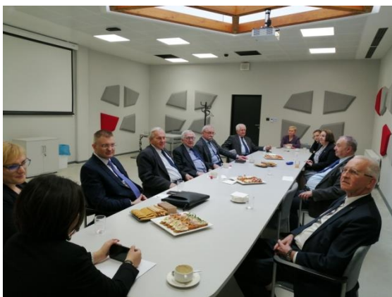
Posiedzenie Prezydiów w sali konferencyjnej ORIENTARIUM