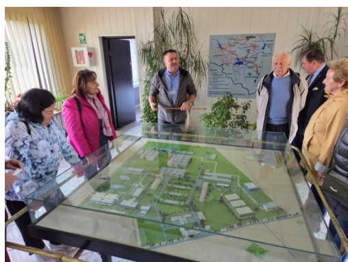
fot. W Zakładzie Uzdatniania Wody

Druga część wycieczki miała charakter rekreacyjny w Ogrodach Kapiasa.