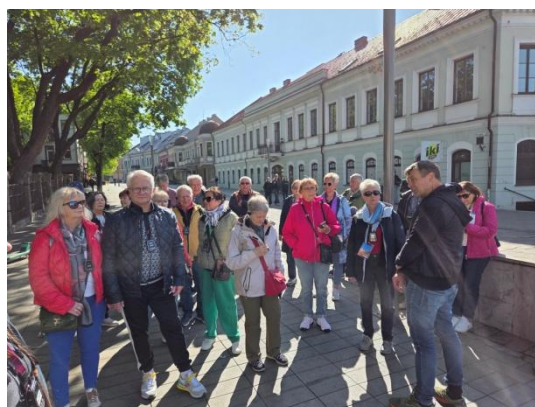
fot. Spacer po Kownie z przewodnikiem

Wycieczka członków i sympatyków OZW SEP na Litwę, Łotwę i Estonię. Relacja z wycieczki ukaże się w nr 4/2025 Śląskich Wiadomości Elektrycznych.