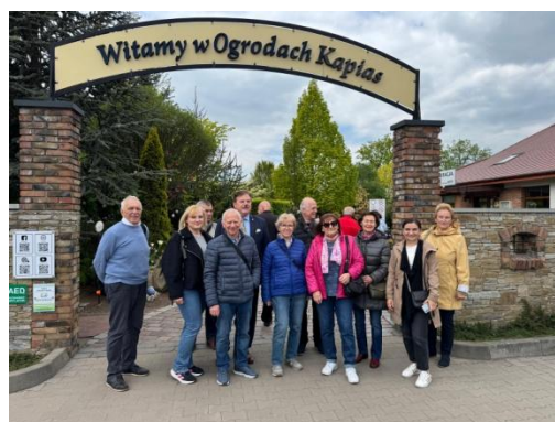
fot. W Ogrodach Kapiasa